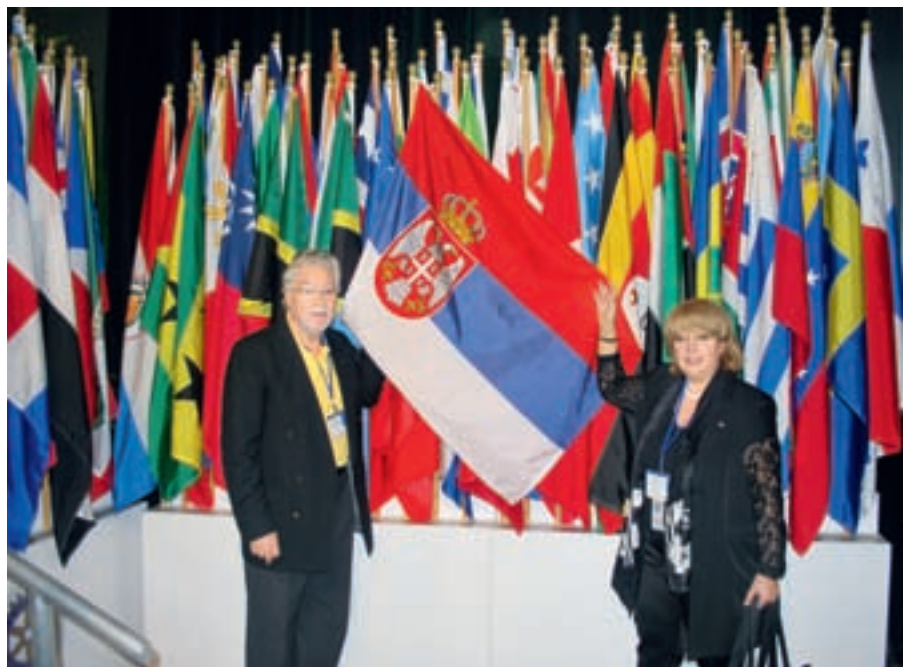
С флаговете на ротаријанските страни