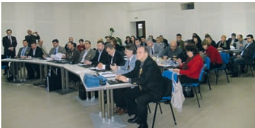
В конферентната зала