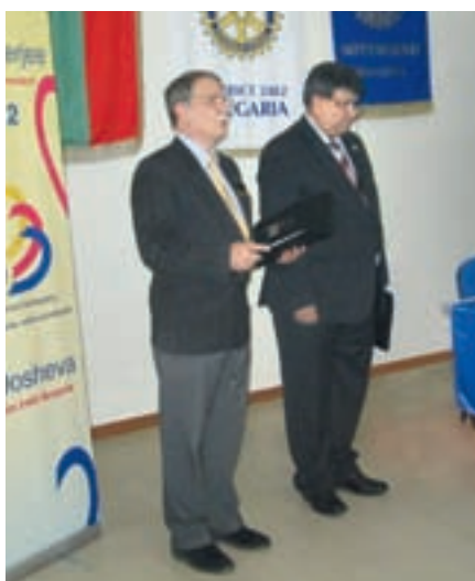
Откриване на семинара

Първият ни акцент през тази ротарианска година е семейството . В семейството започ-